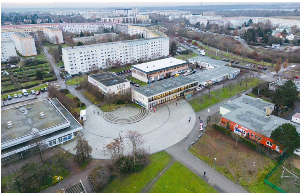
Der triste Jupiterplatz wird am 9. Mai mit Leben gefüllt.