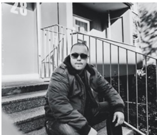
Jurymitglied Morlock Dilemma

Anlässlich des Jubiläums »50 Jahre Grünau« schreibt die Bibliothek Grünau-Süd einen Schreibwettbewerb für alle ab 18 Jahre aus.