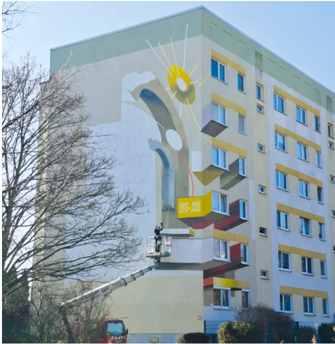
Ein neues Bild ist an der Fassade des VLW-Sechsgeschossers im WK 5.I entstanden. Es erinnert an das einstige »Schwalbennest« und nimmt Bezug auf den 50. Geburtstag von Grünau.