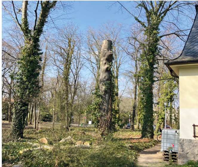
Der Rest der Rotbuche neben dem Haus 4.